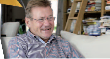
Johan Van Overtveldt