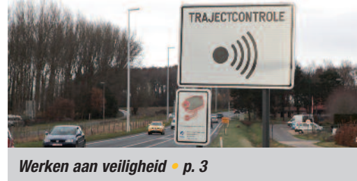
Werken aan veiligheid • p. 3