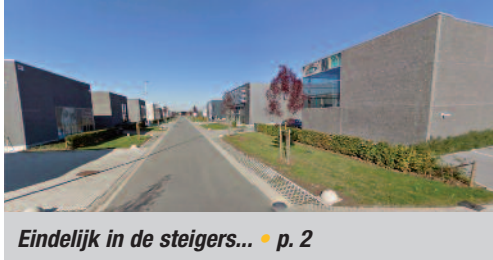
Eindelijk in de steigers... • p. 2